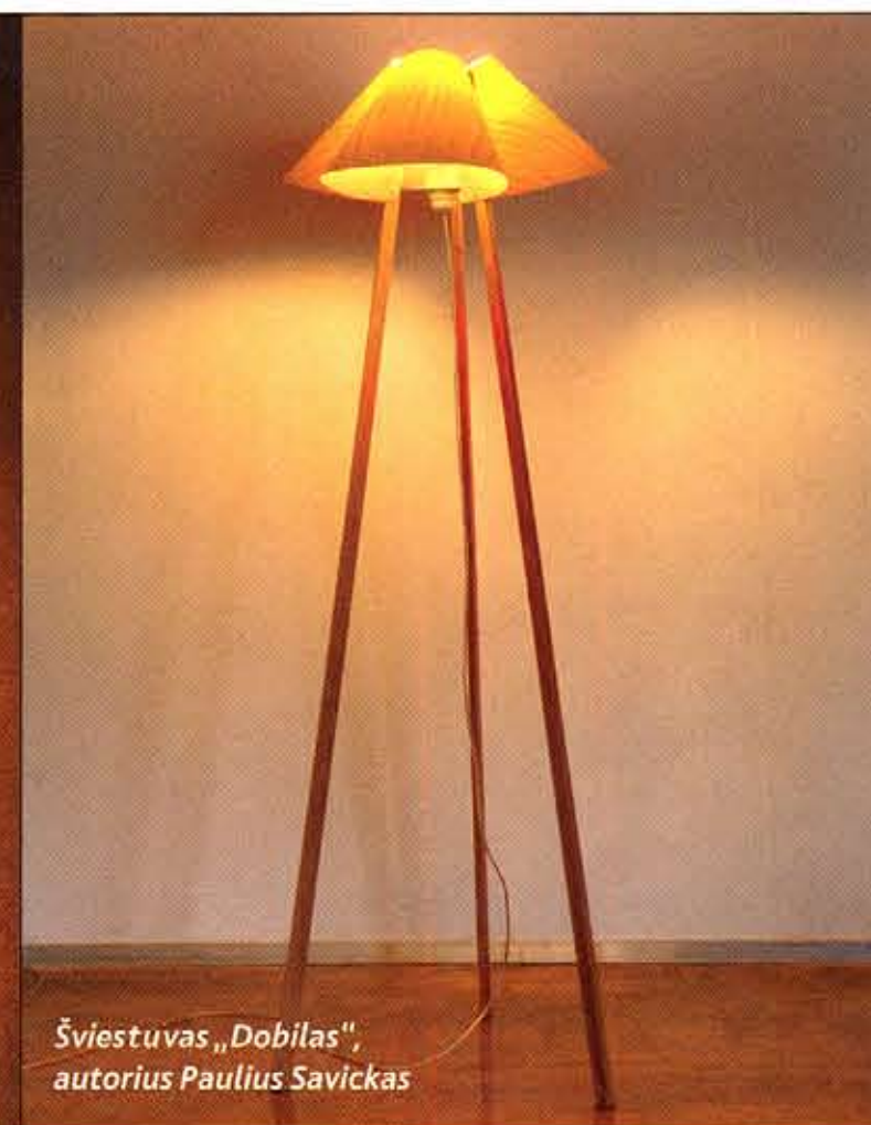
Šviestuvai „Dobilas“, autorius Paulius Savickas