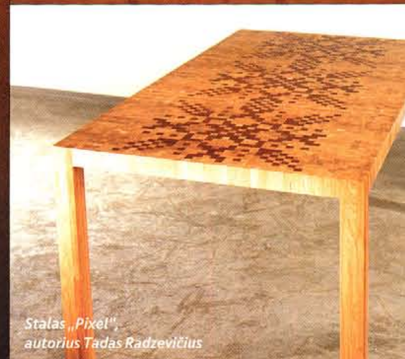
Stalas „Pixel“, autorius Tadas Radzevičius